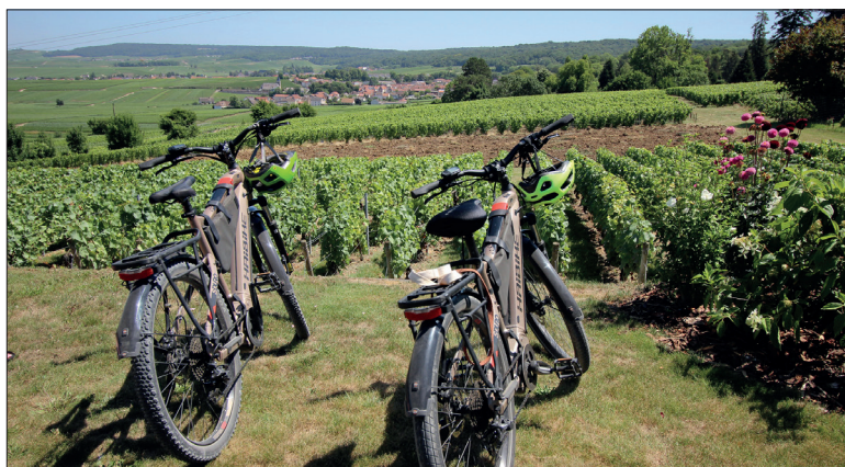
Une route des « Top points de vue » a été lancée.

Si le secteur touristique a été mis à mal pendant la période du covid, il a retrouvé des couleurs ces deux dernières années avec une fréquentation touristique atteignant des records. 2023 n'a pas fait exception dans le secteur sparnacien puisque plus de 3,6