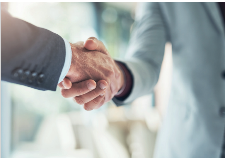
Ce sont les petites entreprises qui proposent le plus grand nombre d'emplois. Celles de moins de 10 salariés comptabilisent 46% des projets.

Emploi. L'enquête de France Travail recense plus de 193 000 besoins en main-d'œuvre pour l'année 2024 dans le Grand Est. C'est un recul de 5% sur un an, mais une progression de 12% par rapport à 2018, période antérieure à la crise sanitaire. Près de 69% de ces projets sont non saisonniers et près de 55% sont jugés difficiles pour les employeurs.