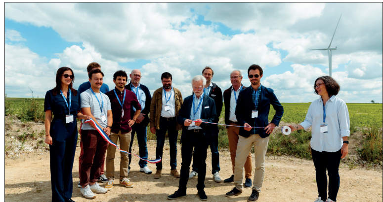
Lors de l'inauguration du parc éolien de Nongée.

Filiale française d'EnBW, l'un des plus grands énergéticiens en Allemagne et en Europe, l'entreprise montpelliéraine VALECO vient de marquer ses premiers pas dans la région.