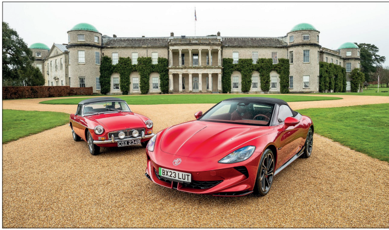
MG B et Cyberster : le lien entre le passé et le présent.

En deux décennies, le « Festival of speed » qui se déroule chaque année dans le sublime cadre du château de Goodwood, à trois tours de roues du circuit éponyme, est devenu un événement automobile mondial où se donnent rendez-vous les marques les plus prestigieuses. Une sorte de garden party mécanique très britannique à laquelle participent non seulement les plus grands constructeurs qui y