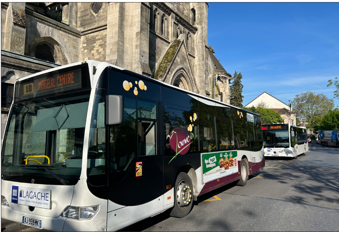
Le réseau Mouvéo, qui s'étend sur 50 communes, compte 10 lignes régulières de transport urbain (pour 17 bus dont six hybrides) et 11 lignes de transport à la demande (portées par 7 minibus).

Transport. Le service transport public de l'agglomération sparnacienne dont la gestion est assurée par RATPDev depuis 2016, a franchi la barre du million de passagers en 2023.