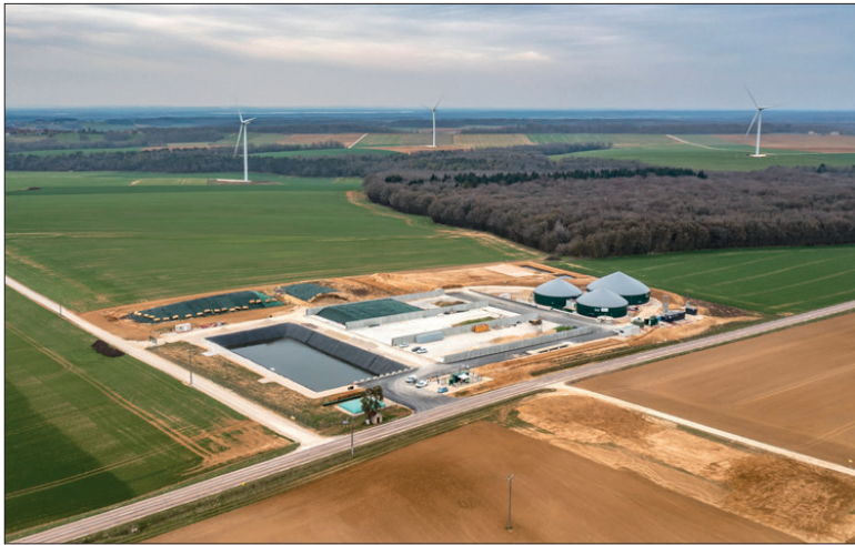
123 installations injectent du biométhane en région Grand Est.

La consommation de gaz en Grand Est baisse de manière plus importante qu'au niveau national en 2023 (-15% contre -11%). L'explication réside dans « un moindre fonctionnement des trois centrales à gaz installées sur la région (-24% par rapport à 2022), conséquence d'une plus grande disponibilité du parc nucléaire, et d'autre