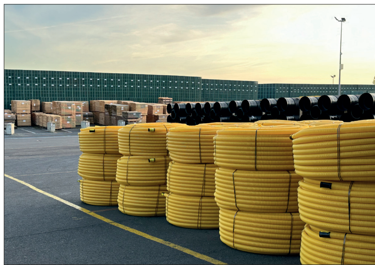
Espace de stockage aérien pour des solutions d'eaux pluviales souterraines.

« Nous avons de beaux jours devant nous », se réjouit Géraldine Rousseau, directrice commerciale et marketing de la filiale auboise Fränkische à Torcy-le-Grand, l'une des rares entreprises à apprécier les pluies diluviennes. « Nous sommes dans un virage du marché où nous devons finalement, pas seulement vendre du produit, mais aussi par exemple, accompagner une collectivité qui aurait la moitié de ses lotissements