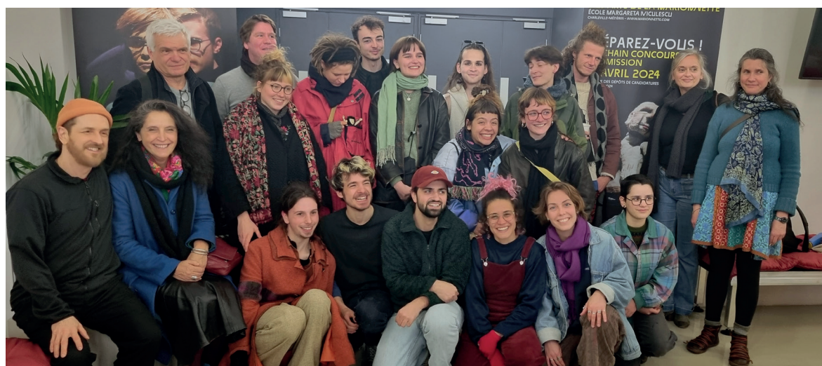
Les candidats et candidates retenus accompagnés des membres du jury de concours.

Seule école dédiée aux Arts de la marionnette en France, l'ESNAM de Charleville-Mézières qui dispense une formation