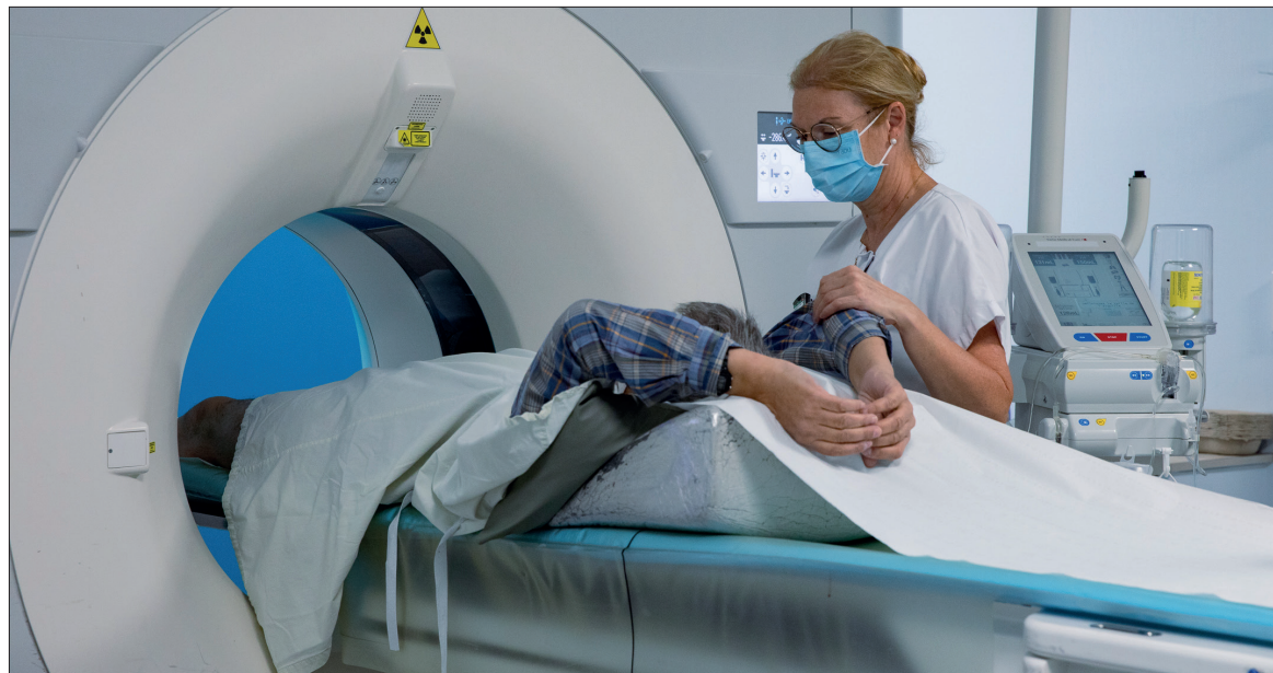
Cette filière sera accessible aux bacheliers à profil scientifique et technologique.

Deux solutions s'avéraient alors possibles : soit recourir à l'une des trente écoles adossées à un CHU en sachant qu'elle n'aurait pas pu répondre à tous les besoins, soit créer un diplôme de technicien supérieur (DTS) dans les Ardennes