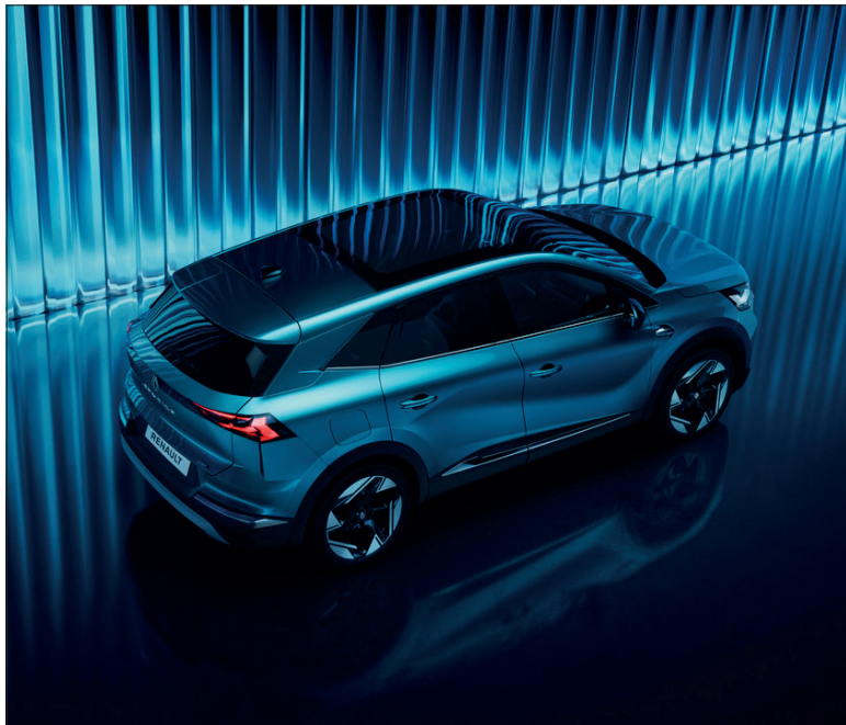
4,41 m pour un inédit Symbioz à la silhouette flatteuse.

Inutile de faire cent fois le tour du hayon pour constater que le nouveau SUV Renault est davantage qu'une version grande taille du Captur, récemment restylé. Prosaïquement, on se bornera à sortir le mètre-ruban pour constater que la longueur à