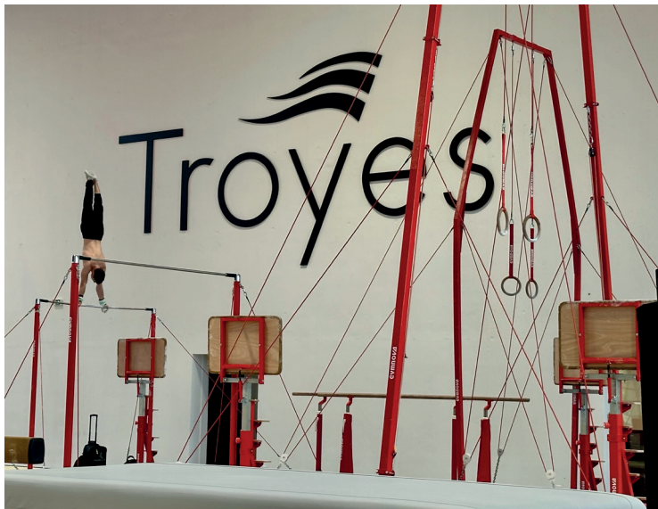
Le Centre sportif de l'Aube s'étend sur plus de 3 000 m².

L'offre packagée, qui associe équipements sportifs de haut niveau, hébergement et restauration, attire les athlètes de tous pays.