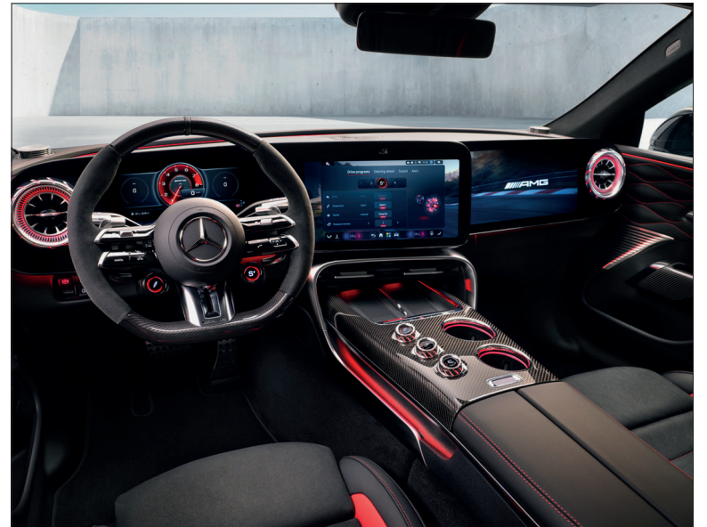
Pour résumer la planche de bord de sa dernière-née, le constructeur parle de « poste de commandement ».

Les records sont faits pour être battus. Le concept de la Mercedes AMG GT-4 en a « pulvérisé » selon l'expression du constructeur pas moins de 25 sur l'anneau de Nardo dans le sud de l'Italie en l'espace de sept jours et 13 heures, le temps de parcourir plus de 40 000 km. Le tour de la Terre ! De quoi donner naissance à une version routière de série n'ayant aucun équivalent dans la production automobile actuelle. Un monstre de technologie électrique qui se présente presque comme une Mercedes classique et prend place esthétiquement dans la jeune gamme actuelle sans trop se faire remarquer.