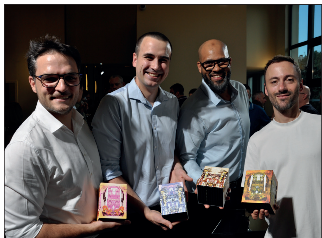
Lors de l'inauguration de l'unité.

IloFrance, c'est ce fabricant d'ordinateur, fondé en janvier 2025 et installé à Bétheny, qui développe une vision originale du PC fixe – souvent moche, il faut bien le dire – jusqu'à en faire un objet élégant, sans rien sacrifier à la performance, bien sûr. Cela