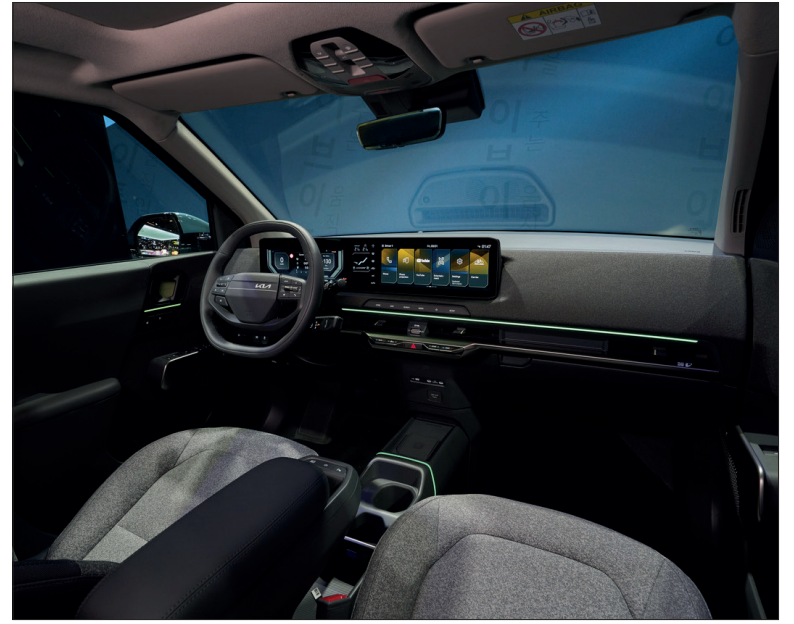
Un aménagement intérieur qui privilégie la simplicité et les aspects pratiques.

La famille EV de Kia est-elle complète avec la commercialisation du SUV EV2 ? Il reste encore quelques chiffres disponibles entre l'EV2 et l'EV9. L'arrivée sur le marché en 2027, d'une EV1 remplaçant la citadine Picanto thermique est un secret de Polichinelle. Mais l'actualité immédiate de Kia, c'est l'EV2, un SUV 100% électrique qui réunit en seulement 4,06 m un ensemble de qualités capable d'en faire le best seller de la large gamme électrique de la marque coréenne.