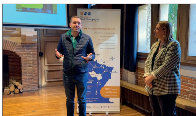
Le business café du 11 juin dernier a présenté les dispositifs accessibles aux entreprises pour attirer les compétences et leurs familles.

Il ne suffit pas d'un emploi pour s'ancrer dans un territoire, cela reste aussi et avant tout, une histoire de famille. Alors, les collectivités et chambres consulaires multiplient les accompagnements pour attirer les compétences avec une offre globale qui tient compte autant du futur salarié que de sa famille. Des dispositifs présentés lors d'un business café organisé par l'agence territoriale BusinessSud Champagne à une trentaine d'entreprises avec les témoignages de celles qui recrutent et veulent garder les compétences.