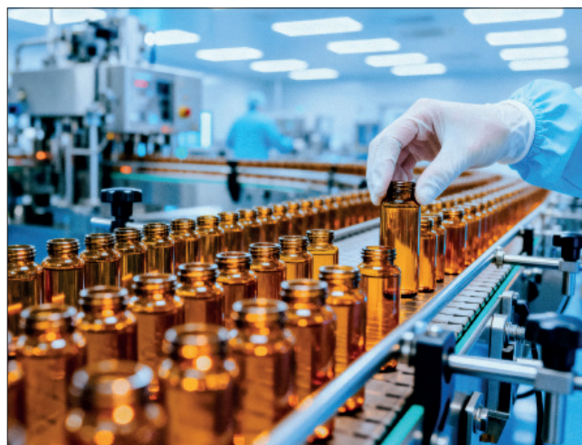
La Marne exporte surtout du Champagne et des produits pharmaceutiques aux Etats-Unis et à la Belgique.

Au premier trimestre 2026, les exportations régionales s'élèvent à près de 17,6 milliards d'euros, soit une progression de 4% par rapport au premier trimestre 2025. Dans le même intervalle de temps, les importations, légèrement au-dessus de 16 milliards d'euros, baissent de 1,3%. Conséquence, le solde des échanges triple quasiment en passant de +0,5 à +1,4 mil-