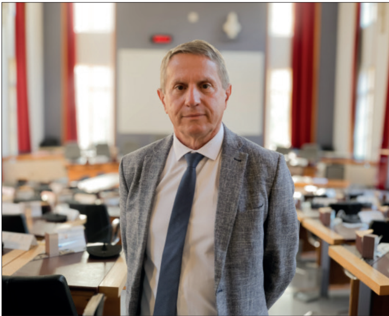
Enfin de bonnes nouvelles pour Noël Bourgeois, Président du Conseil départemental des Ardennes, qui continue néanmoins de critiquer le dispositif de péréquation de l'Etat qui ne suffit pas à effacer les disparités.

Finances. Le département des Ardennes bénéficie de deux soutiens financiers majeurs avec plus de 9 millions d'euros de l'État au titre du fonds de sauvegarde et 9 millions d'euros de la Région Grand Est et du Feder pour des projets structurants.