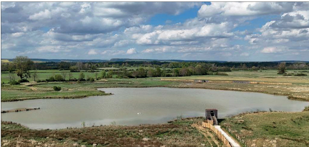
Othe-Armance est le premier territoire du Grand-Est à obtenir le label Green destinations et le 16 e de France.

La destination Othe-Armance devient la 16 e destination de France et la première de la région Grand Est à recevoir la certification Green Destinations. Elle entre dans le giron restreint des 120 destinations mondiales certifiées dans 25 pays. Avec le niveau « Bronze » et un taux de réussite de 67%, cette distinction internationale, remise lors du Salon ITB de Berlin, salue l'engagement collectif d'un territoire résolument tourné vers un tourisme plus durable.