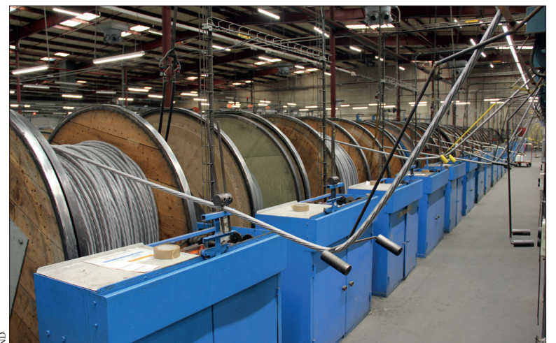
4 familles de tuyaux sont produits par Tricoflex : tuyaux équipés, tricotés, spiralés et non armés soit 40 000 km de tuyaux par an.