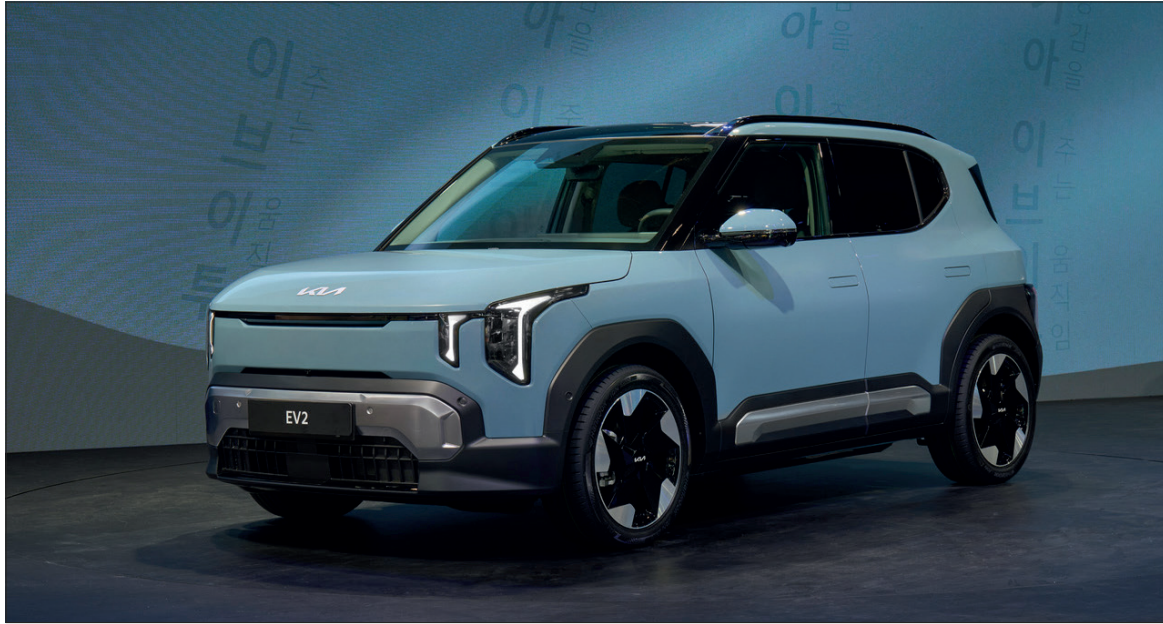
En seulement 4,06 m, le SUV Kia concilie compacité et habitabilité.