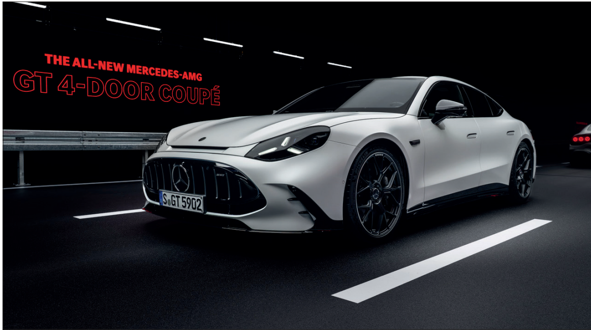
Une silhouette de coupé quatre portes très efficace aérodynamiquement.