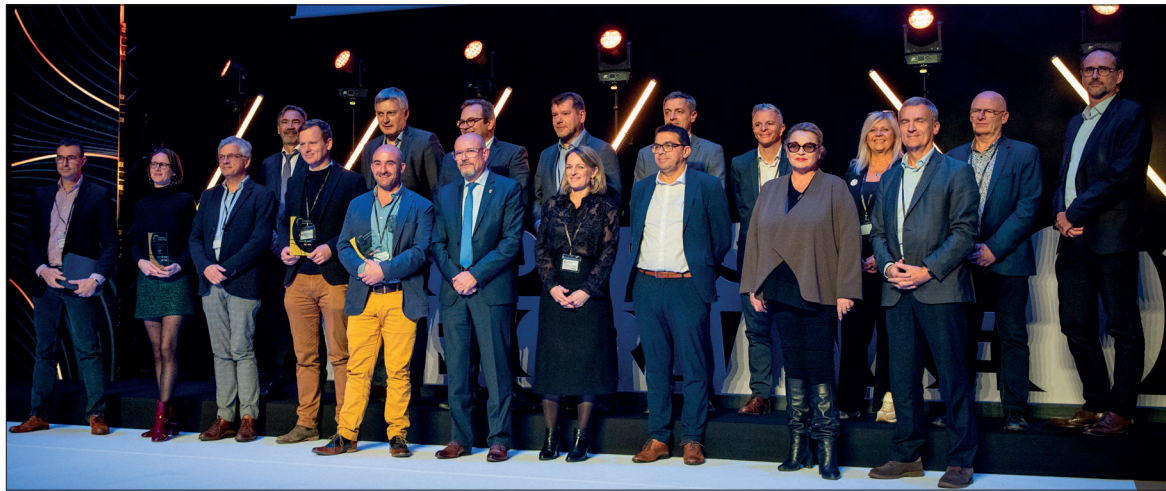
Rendez-vous l'an prochain, à Laon, pour le 11 e Gala Passion d'Entreprendre.