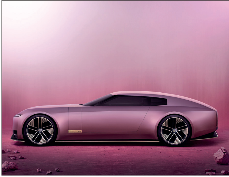
Rose ou bleu : le concept 00 se distingue par son design brutal.