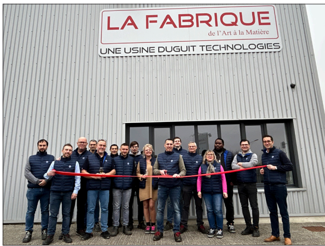
La Fabrique compte une quinzaine de collaborateurs sur son site de Magenta (Marne).

Fruit d'un investissement de 2,4 millions d'euros, La Fabrique est le nouveau site de production de l'entreprise Duguit Technologies. Cette dernière, avec ses entités Champagel et Allians Robotics est aujourd'hui leader mondial de la congélation des cols de bouteilles, expert en robotique et manutention de bouteilles en verre. Grâce à cette nouvelle implantation à Magenta (Marne), Timothée Duguit envisage de nouvelles perspectives pour son groupe, qui possède également l'entreprise Bedi (Bourgogne) et Fege (Ardennes). Ponts roulants, machines de découpe au jet d'eau, machines d'usinage de métaux sur tour numérique quatre axes... « Avec ce site, nous ouvrons de nouvelles capacités de production en termes de volumes. Nous pouvons aussi désormais réaliser toutes les pièces en interne et envisager de déve-