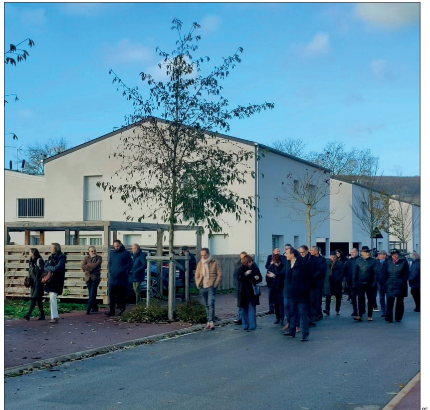
Page 3 À Épernay, Action Logement Services et Plurial Novilia redynamisent la ville.